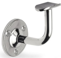
ST - 303