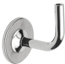
ST - 350