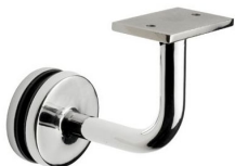
ST - 315