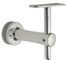
SA - 423 (BF - FLAT)