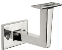
ST - 335