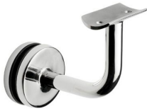
ST - 314