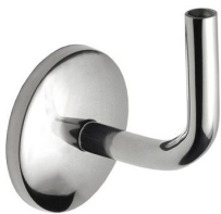
ST - 352