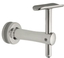
SA - 423 (BF - R)