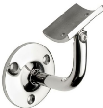
SA - 410