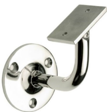
SA - 411