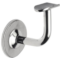
ST - 340