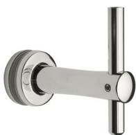
SA - 423 (BF - 00)