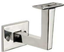
ST - 335