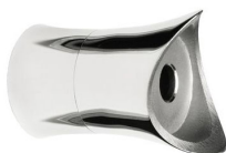
ST - 313