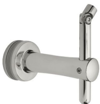
SA - 423 (BG - 00)