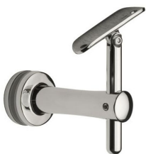
SA - 423 (BG - R)